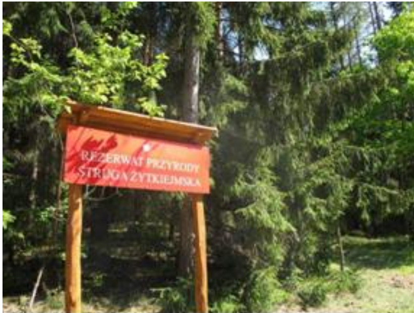
Rezerwat przyrody Struga Żytkiejmska

Powierzchnia rezerwatu wynosi 476 ha, z tego 91,3 ha zajmują torfowiska, występujące w dolinie rzeki Żytkiejmska Struga. Rzeczka ta jest prawobrzeżnym dopływem Błędzianki, ma długość 26,4 km, z czego 15,4 km płynie na terenie Polski. Rezerwat położony jest w powiecie gołdapskim, w gminie Dubeninki, na terenie Parku Krajobrazowego Puszczy Rominckiej w nadleśnictwie Gołdap. Powstał w 1982 roku w celu zachowania rzadkich gatunków flory i fauny. Teren rezerwatu odznacza się bardzo urozmaiconą rzeźbą, wynikającą z przeplatania się licznych wzgórz i obniżeń morenowych.