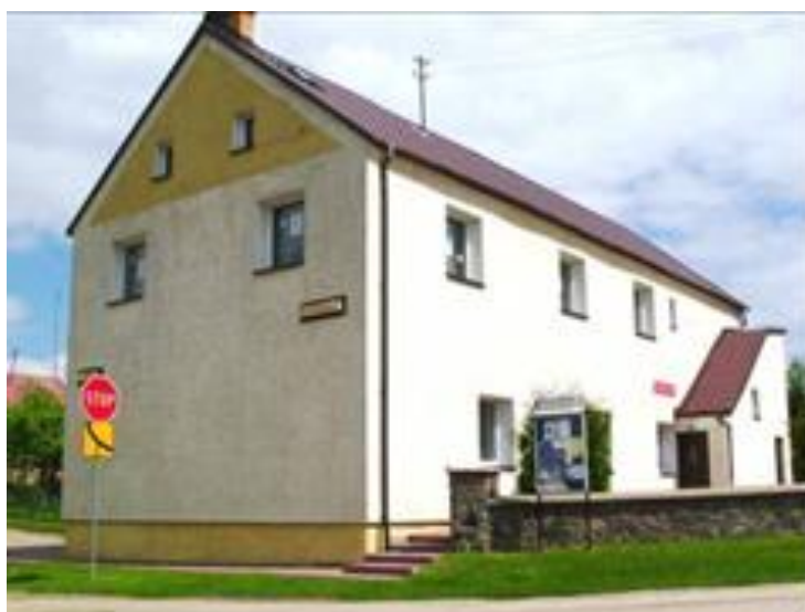
Żytkiejmy – budynek świetlicy i biblioteki