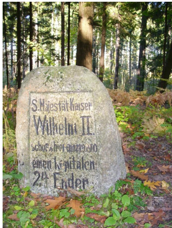
Pamiętkowe kamienie w Puszczy Rominckiej