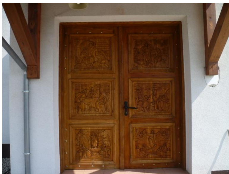
Żytkiejmy – drzwi wejściowe do kościoła