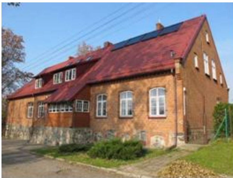
Żytkiejmy, siedziba Parku Krajobrazowego Puszczy Rominckiej

Utworzony 14 stycznia 1998 r. leży w wysuniętym najbardziej na północny wschód krańcu woj. warmińsko-mazurskiego, w części obszaru gmin Gołdap i Dubeninki. Obszar parku wynosi 146,2 km 2 , a otuliny 85 km 2 . Teren jest w 80% zalesiony, miejscami przypominający tajgę. Park przecinają doliny rzek Błędzianki, Bludzi i Czerwonej Strugi. Północna granica parku pokrywa się z granicą polsko-rosyjską. Wschodnia i południowa granica parku biegnie nasypem niemieckiej linii kolejowej z początku XX wieku z Gołdapi przez Golubie, Żytkiejmy do Gąbina. W Stańczykach przez dolinę rzeki Błędzianki przerzucono dwa mosty o wys. 36,5 m.