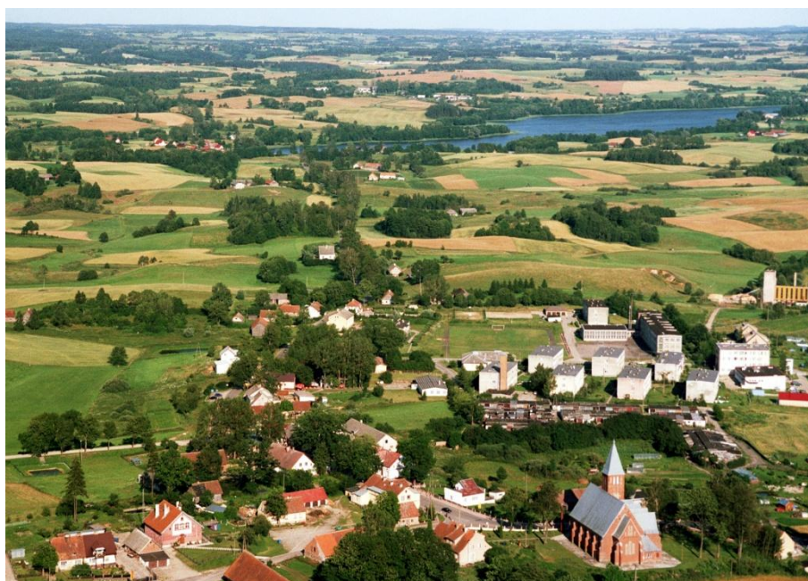
Dubeninki z lotu ptaka