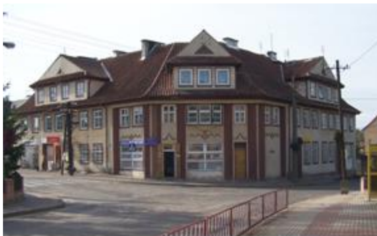
Żytkiejmy – kamienica narożna przy głównym skrzyżowaniu

Posiadają układ wielodrożnicowy oraz dość gęstą zabudowę, co nadaje tej miejscowości charakter miejski. Na terenie wsi znajduje się 20 obiektów w zainteresowaniu konserwatorskim. Spośród nich jedynie kościół poewangelicki jest wpisany do rejestru zabytków (kościół o proveniencji gotyckiej uzyskał w 1879 roku nowy wygląd).