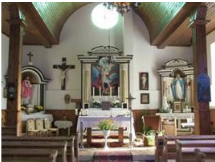
Żytkiejmy wewnątrz kościoła