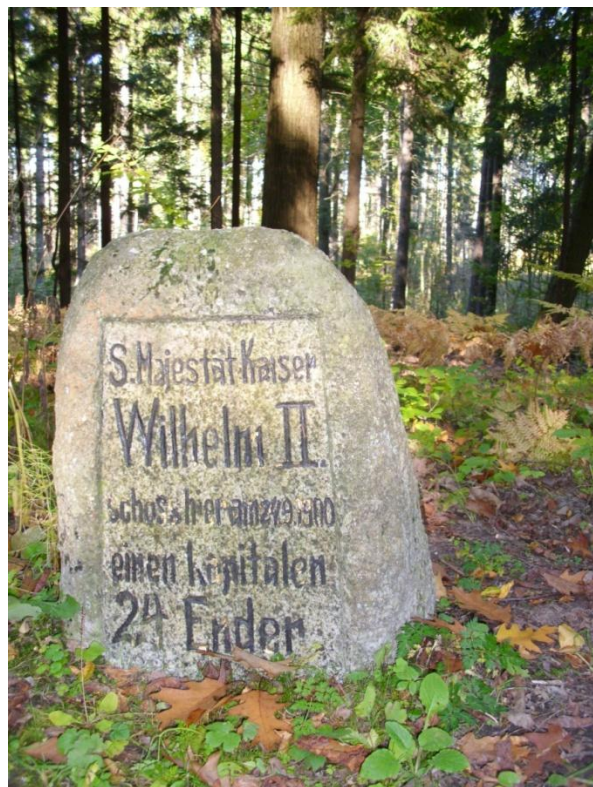
Pamiętkowe kamienie w Puszczy Rominckiej