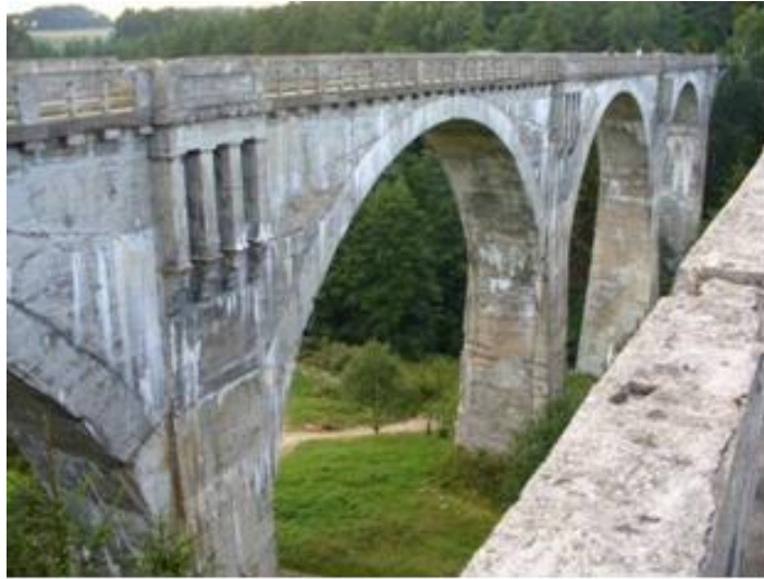
Stańczyki - mosty kolejowe

Surowe warunki klimatyczne powodują, że szata roślinna Parku jest specyficzna i zawiera wiele osobliwości. Najbardziej charakterystycznym dla Puszczy zbiorowiskiem jest typowy dla tajgi borealnej las świerkowy, mroczny, wilgotny, z grubym dywanem mchów. Na pagórkach i zboczach rosną lasy liściaste z lipą, klonem, grabem i wiązem w drzewostanie, natomiast na piaszczystych wzniesieniach rośnie leszczynowo-świerkowy las mieszany. W zatorfionych dolinach strumieni występują łągi jesionowo-olszowe z chronionym pióropusznikiem strusim, a zagłębienia pojeziorne zajmują bogate gatunkowo torfowiska porośnięte m.in. rzadkimi i chronionymi roślinami.