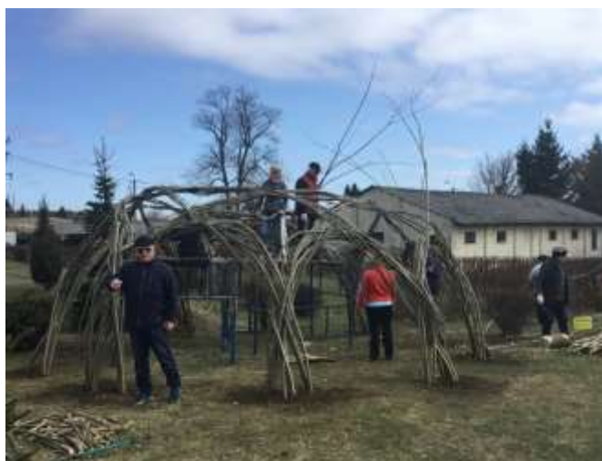
Warsztaty tworzenia żywych form wierzbowo-wiklinowych

Wartość projektu – 50 000,00 zł, dofinansowanie projektu: 31 815,00 zł