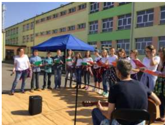
Koncert podczas Majówki