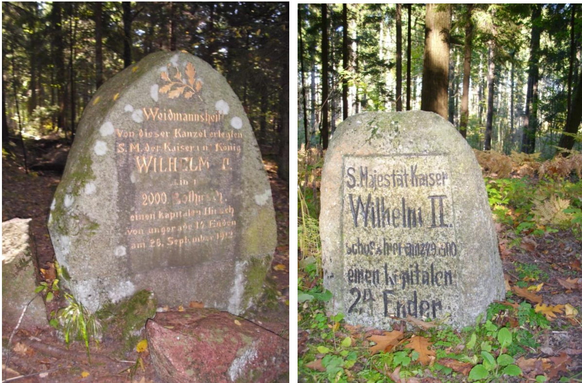
Pamiętkowe kamienie w Puszczy Rominckiej

Kamienie są zlokalizowane w różnych miejscach puszczy, nieraz przy drogach, niekiedy w trudno dostępnych ostępach. Stan ich zachowania jest dobry.