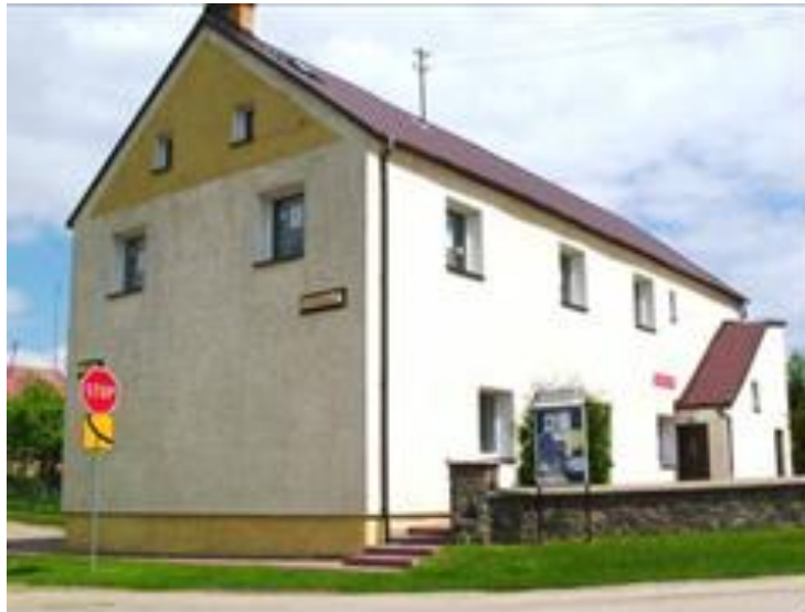
Żytkiejmy – budynek świetlicy i biblioteki

W strukturach samorządowej instytucji kultury funkcjonuje Gminna Biblioteka Publiczna w Dubeninkach z Filią w Żytkiejmach. Według danych statystycznych placówki biblioteczne w 2015 roku dysponowały 21833 woluminami książek oraz opłaciły dostęp do 743 tytułów książek elektronicznych. W roku 2015 zarejestrowano 430 użytkowników, z tego 343 czytelników aktywnie wypożyczających. W omawianym okresie zanotowano: 4754 odwiedzin, 8299 wypożyczeń książek na miejscu i na zewnątrz; korzystanie z zbiorów elektronicznych: 301 sesji oraz 1901 pobranych dokumentów. Biblioteki systematycznie opracowują komputerowo zbiory biblioteczne, opracowano 69% ogólnej liczby zbiorów. Katalog online znajduje się na stronie www.gckdubeninki.pl w zakładce katalog.