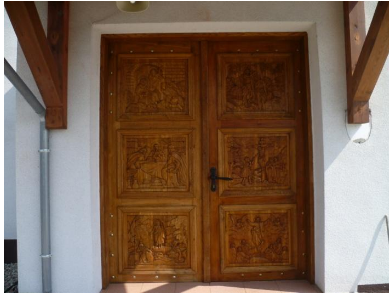
Żytkiejmy – drzwi wejściowe do kościoła