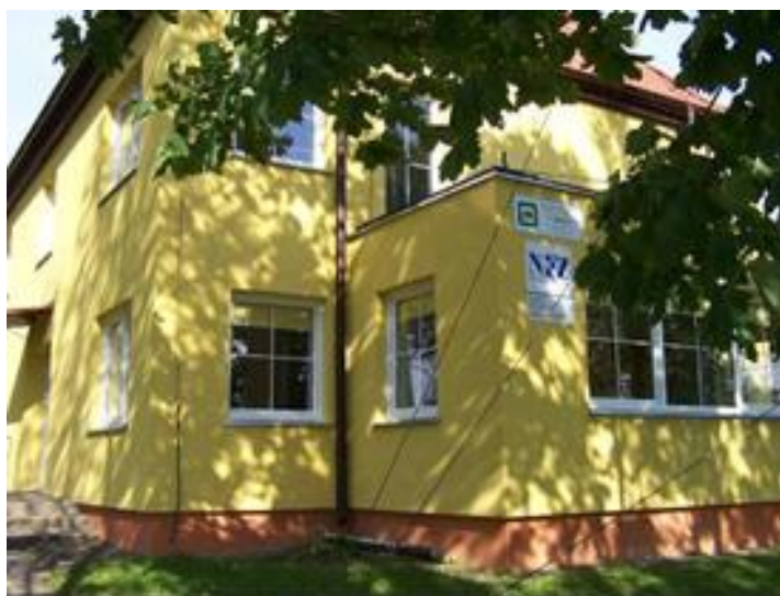
Żytkiejmy ośrodek zdrowia

Na terenie gminy znajdują się dwa ośrodki zdrowia w Dubeninkach i Żytkiejmach w których działają Niepubliczne ZOZ obsługiwane przez lekarzy rodzinnych, po jednym w każdym ośrodku. Na terenie gminy brak jest poradni specjalistycznych.