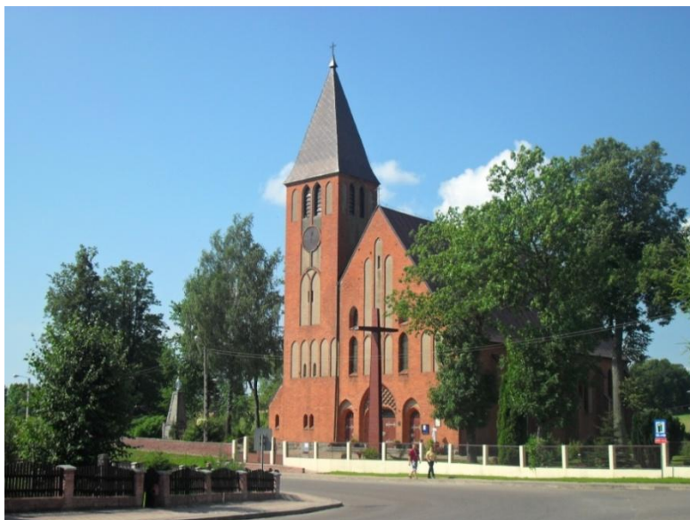
Dubeninki – kościół rzymsko-katolicki