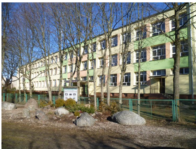
Dubeninki – budynek szkoły podstawowej i gimnazjum