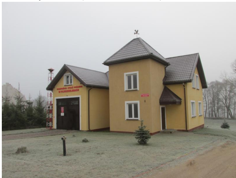
Pluszkiejmy remiza OSP