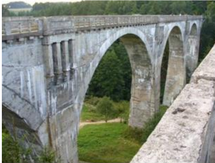
Stańczyki - mosty kolejowe

Surowe warunki klimatyczne powodują, że szata roślinna Parku jest specyficzna i zawiera wiele osobliwości. Najbardziej charakterystycznym dla Puszczy zbiorowiskiem jest typowy dla tajgi borealnej las świerkowy, mroczny, wilgotny, z grubym dywanem mchów. Na pagórkach i zboczach rosną lasy liściaste z lipą, klonem, grabem i wiązem w drzewostanie, natomiast na piaszczystych wzniesieniach rośnie leszczynowo-świerkowy las mieszany. W zatorfionych dolinach strumieni występują łągi jesionowo-olszowe z chronionym pióropusznikiem strusim, a zagłębienia pojeziorne zajmują bogate gatunkowo torfowiska porośnięte m.in. rzadkimi i chronionymi roślinami.