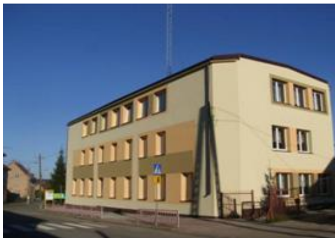
Żytkiejmy – budynek szkoły podstawowej

Na terenie Gminy Dubeninki znajdują się trzy szkoły: Szkoła Podstawowa Dubeninki, Szkoła Podstawowa Żytkiejmy i Gimnazjum w Dubeninkach z oddziałem zamiejscowym w Żytkiejmach. Baza szkoły na terenie Dubeninek to: budynek szkolny użytkowany przez dwie szkoły oraz sala gimnastyczna, boisko asfaltowe, boisko trawiaste, boisko do piłki siatkowej oraz bieżnie. Szkoła posiada również działkę rolną. Budynek szkoły i sali gimnastycznej jest ogrzewany przez kotłownię szkolną. Baza Szkoły Podstawowej w Żytkiejmach to: budynek szkolny, budynek sali gimnastycznej oraz budynek oddziału przedszkolnego, w którym mieści się stołówka szkolna (częściowo zamieszkały przez osoby prywatne), boisko trawiaste, oraz boisko nieutwardzone przy sali gimnastycznej. Budynek szkoły i oddziału przedszkolnego są ogrzewane przez kotłownie lokalne, zaś budynek Sali gimnastycznej posiada ogrzewanie elektryczne.