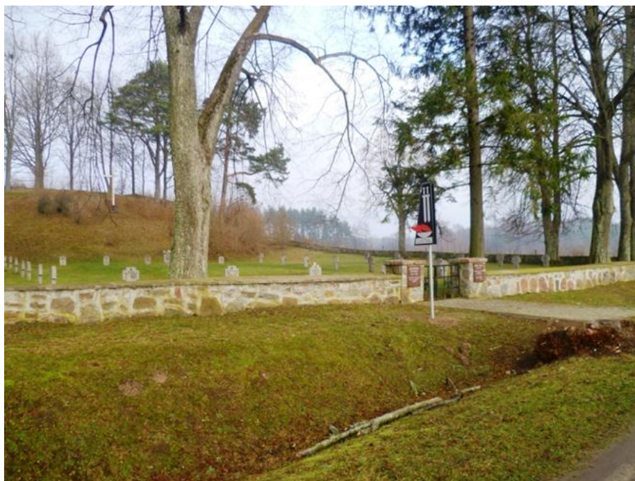
Cmentarz wojenny z I wojny światowej w Żytkiejmach, fot. Arch. gminy

Specyficzną grupę stanowią cmentarze wojenne z I wojny światowej. Są one zlokalizowane w Dubeninkach i Żytkiejmach. Spoczywają na nich żołnierze niemieccy i rosyjscy polegli w latach 1914 - 1915. Oba obiekty wyróżniają się rozmachem przestrzennym i ciekawym rozplanowaniem.