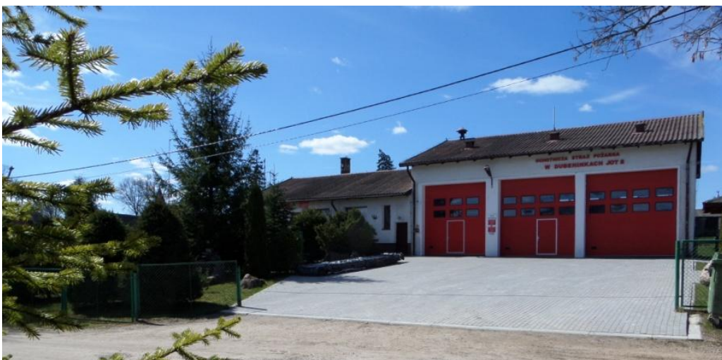
Dubeninki remiza OSP

Ochrona przeciwpożarowa w gminie zorganizowana jest przez Ochotniczą Straż Pożarną, która dysponuje remizami w Dubeninkach, Żytkiejmach, Błąkałach, Pluszkiejmach, Czarnem i Cisówku. OSP w Czarnem i Cisówku nie posiada wozów bojowych, dysponuje tylko sprzętem.