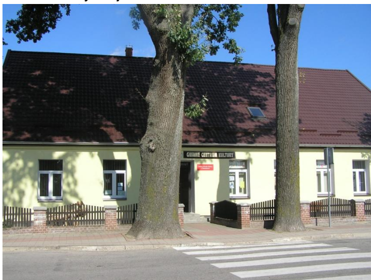
Dubeninki – budynek Gminnego Centrum Kultury