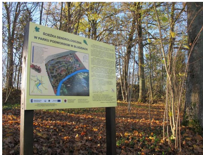
Tablica informacyjna – park podworski w Bludziach

Zabytkowy park w Bludziach jest częścią dawnego zespołu dworsko-parkowego. Położony jest 3 km na północ od Dubeninek. Park został założony w stylu krajobrazowym na wzgórzu stromo opadającym ku rzece Bludzi.