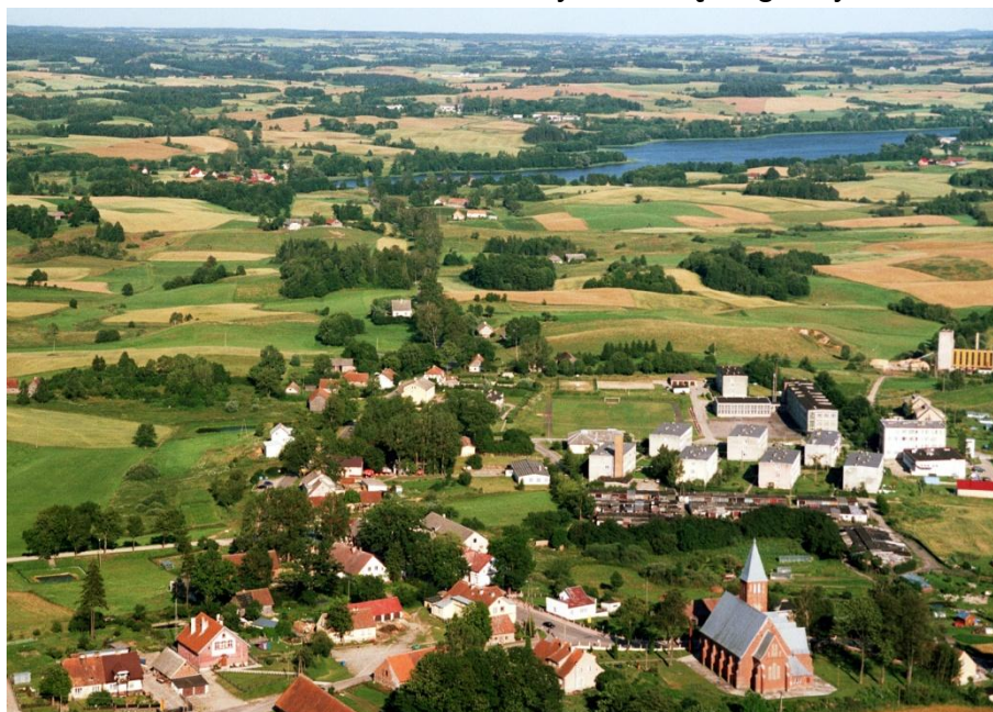
Dubeninki z lotu ptaka