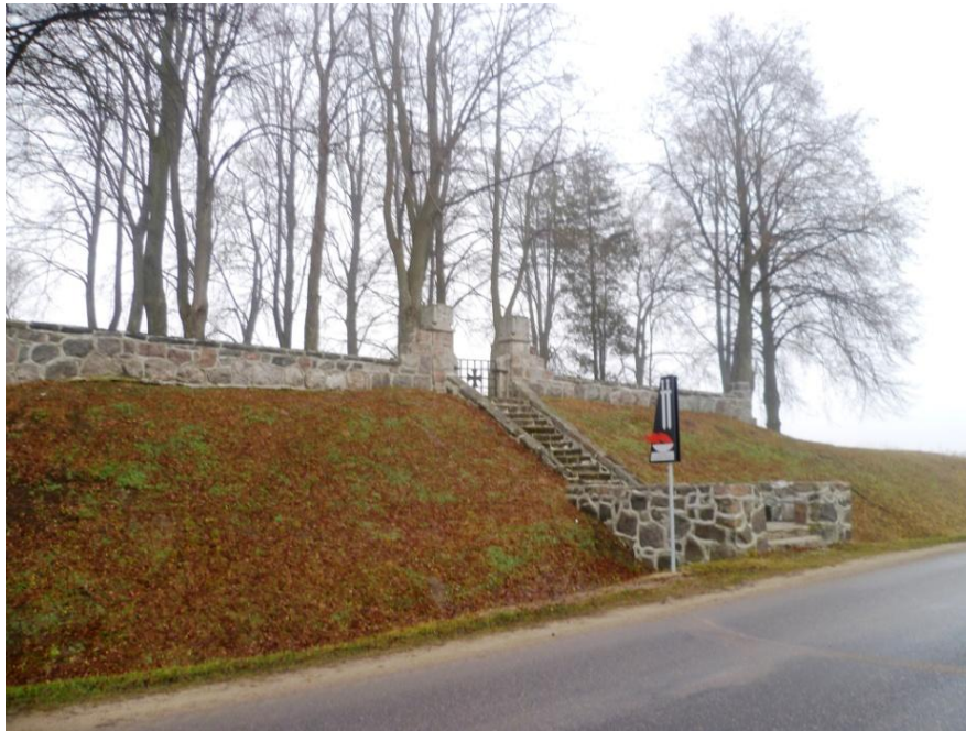
Cmentarz wojenny z I wojny światowej w Dubeninkach

Stan cmentarzy ewangelickich jest zły lub bardzo zły. Są one zarośnięte samosiejkami, niektóre zdewastowane. Cmentarze wojenne zostały odrestaurowane w latach 1992 - 1994 oraz w roku 1997. Stan ich jest dobry.