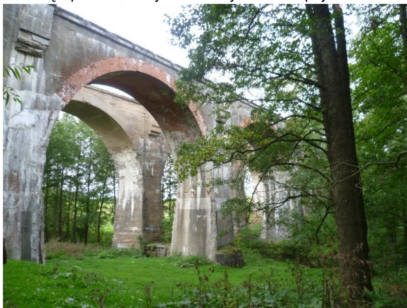
Kiepojcie – mosty kolejowe

Obiekty kubaturowe związane z nieczynną linią kolejową stanowią cenne elementy założeń przestrzennych wsi Dubeninki i Żytkiemy. Wiele mniejszych obiektów pomocniczych (np. dróżnicówki) zniknęły z krajobrazu po roku 1945. Do rejestru zabytków są wpisane mosty w Stańczykach i Kiepojciach.