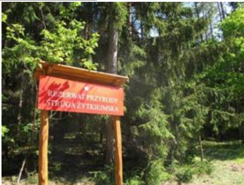
Rezerwat przyrody Struga Żytkiejska

Powierzchnia rezerwatu wynosi 476 ha, z tego 91,3 ha zajmują torfowiska, występujące w dolinie rzeki Żytkiejska Struga. Rzeczka ta jest prawobrzeżnym dopływem Błędzianki, ma długość 26,4 km, z czego 15,4 km płynie na terenie Polski. Rezerwat położony jest w powiecie gołdapskim, w gminie Dubeninki, na terenie Parku Krajobrazowego Puszczy Rominckiej w nadleśnictwie Gołdap. Powstał w 1982 roku w celu zachowania rzadkich gatunków flory i fauny. Teren rezerwatu odznacza się bardzo urozmaiconą rzeźbą, wynikającą z przeplatania się licznych wznórz i obniżeń morenowych.