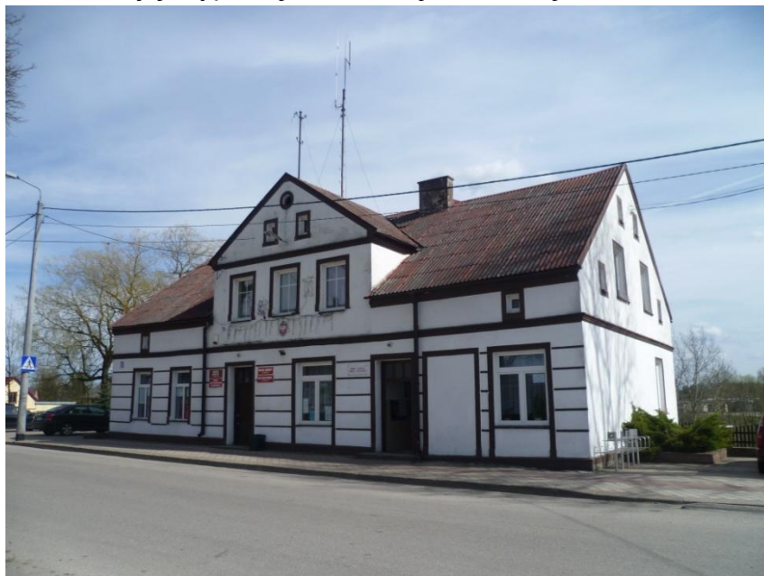
Dubeninki – budynek urzędu gminy

Wieś Dubeninki przejęła rolę ośrodka dominującego na terenie gminy Dubeninki. Zbudowano tutaj kilka budynków o formach użytecznych, które wyraźnie i niekorzystnie kontrastują z typową zabudową mazurską.