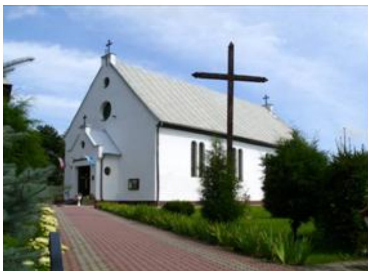
Żytkiejmy kościół rzymsko-katolicki