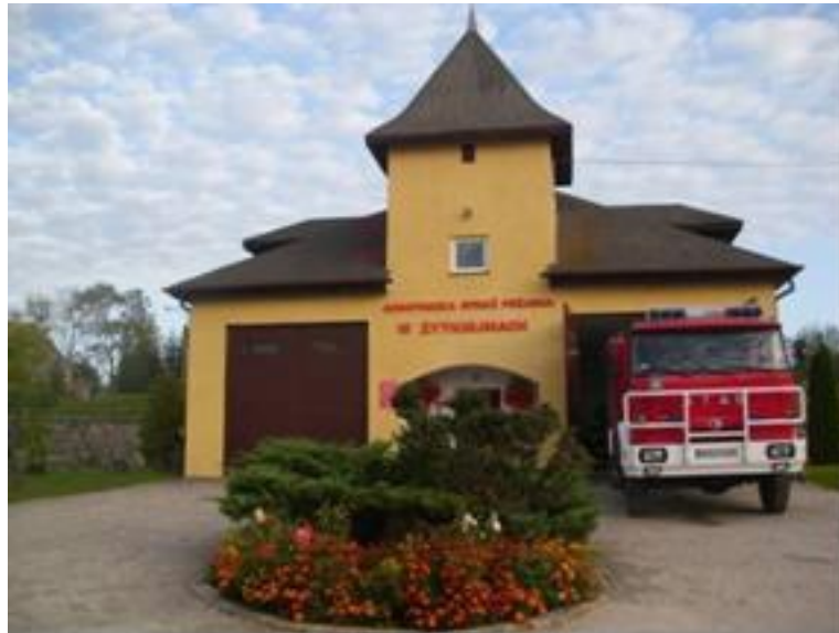
Żytkiejmy remiza OSP

Wykaz ochotniczych straży pożarnych funkcjonujących na terenie gminy Dubeninki: powołanych jest 6 jednostek Ochotniczych straży Pożarnych w tym: