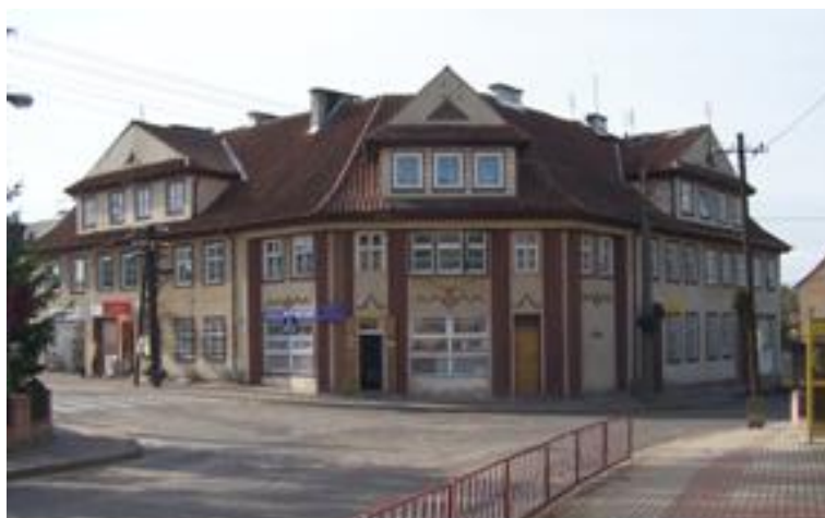
Żytkiejmy – kamienica narożna przy głównym skrzyżowaniu

Posiadają układ wielodrożnicowy oraz dość gęstą zabudowę, co nadaje tej miejscowości charakter miejski. Na terenie wsi znajduje się 20 obiektów w zainteresowaniu konserwatorskim. Spośród nich jedynie kościół poewangelicki jest wpisany do rejestru zabytków (kościół o proveniencji gotyckiej uzyskał w 1879 roku nowy wygląd).