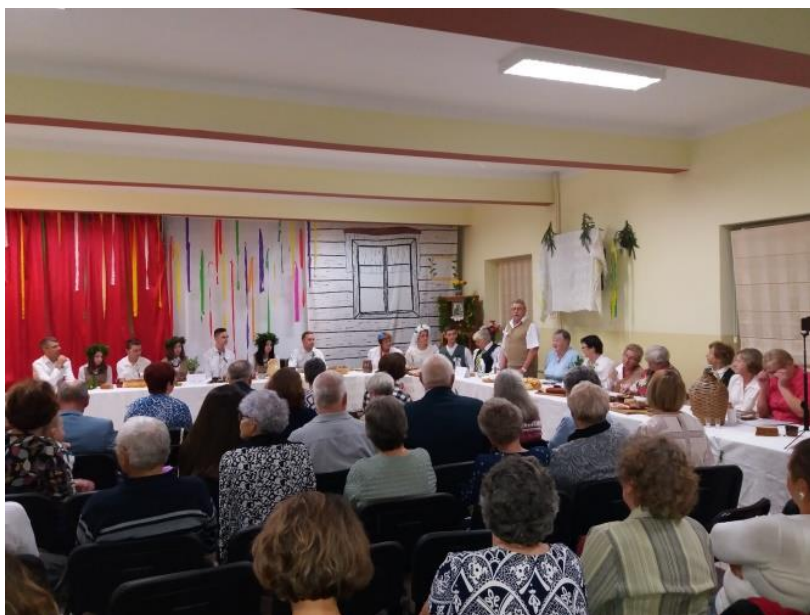
Fragment obrzędu weselnego na wsi mazurskiej pn. „Ludowe wesele”