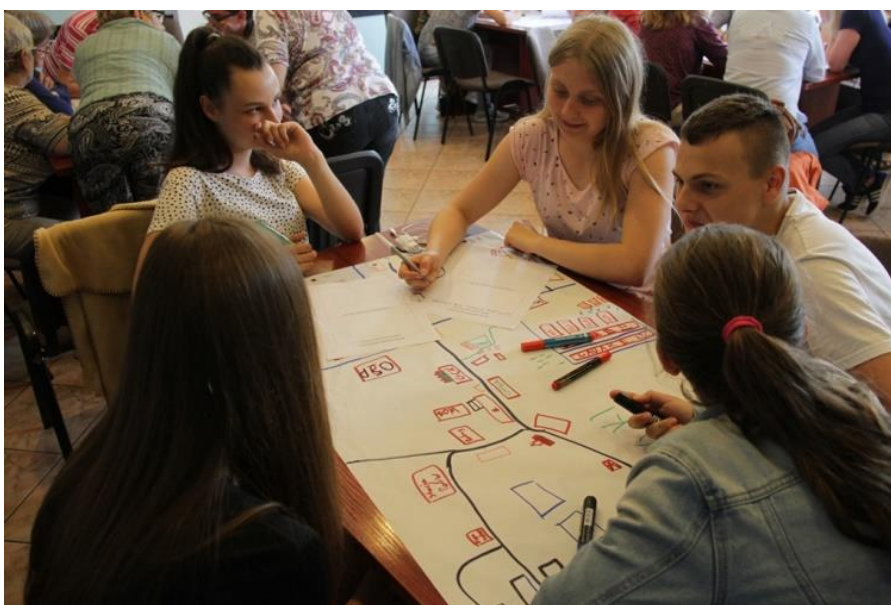
Spotkanie tworzenia mapy kulturalnej Gminy Dubeninki

Wartość projektu – 31500 zł, dofinansowanie projektu: 30000 zł