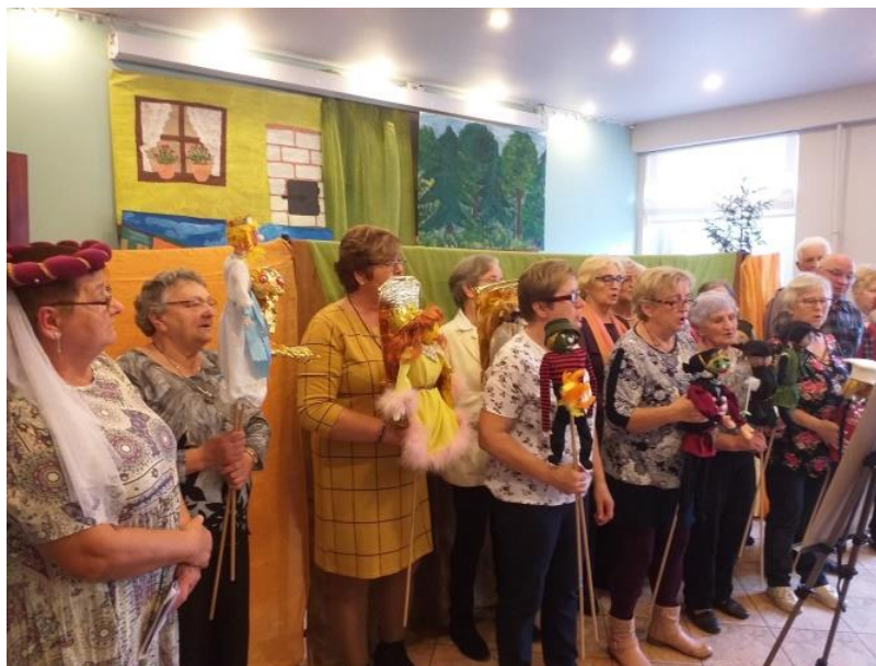
Premiera przedstawienia kukiełkowego pt. „Złota gęś”